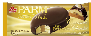
PARM(パルム) キャラメル・バナヌショコラ(1本入り)