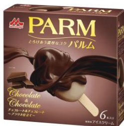
PARM(パルム) チョコレート&チョコレート ~ブラリネ仕立て~(6本入り)