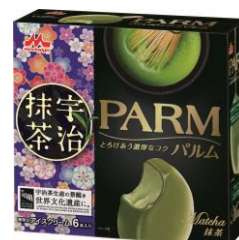
PARM(パルム) 抹茶(6本入り)