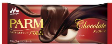
PARM(パルム) チョコレート(1本入り)