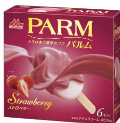
PARM(パルム) ストロベリー (6本入り)