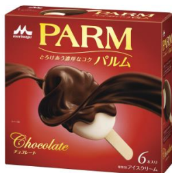
PARM(パルム) チョコレート(6本入り)