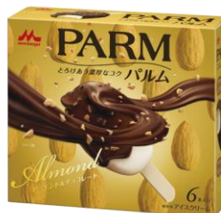
PARM(パルム) アーモンド&チョコレート (6本入り)